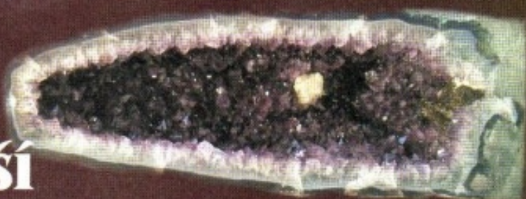
Ametystová geoda z Brazílie, oblast Minas Gerais